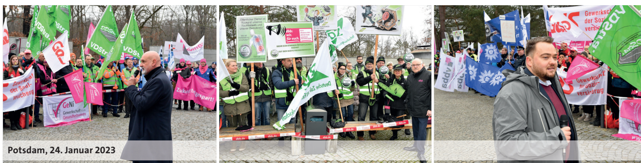
Potsdam, 24. Januar 2023

In der Verhandlungskommission wurde Silberbachs Aufforderung positiv aufgenommen. Angesichts des wenig erfreulichen Arbeitgeberruftritts werden die betroffenen Fachgewerkschaften des dbb